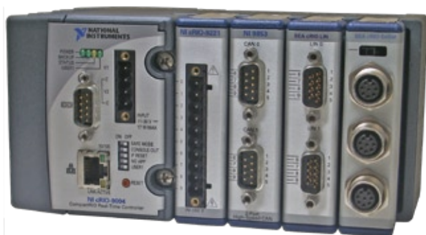
CompactRIO - System mit S.E.A. LIN und EnDat Modul sowie NI CAN und IO-Modul